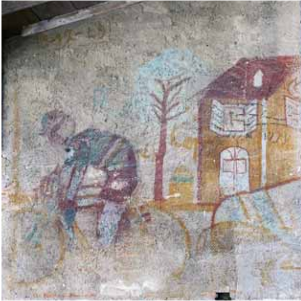
Badia Calavena, contrada Gonci: Il Ciclista . Autore: Adriano Anselmi (1949).

L'autore, per redigere la pittura, ha fatto uso di terre colorate del posto, in quegli anni particolarmente ricercate: il rosso e il giallo; il verde, invece, ha natura vegetale.