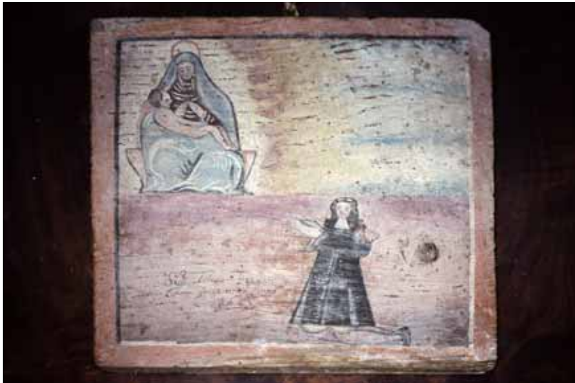
Tregnago, loc. Scornano, Chiesa dell'Annunziata: Ex voto di El Re.