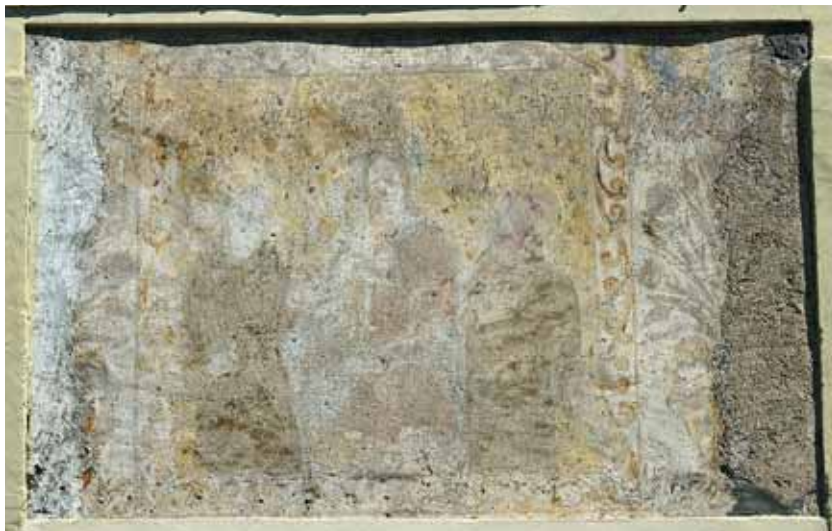
Badia Calavena, contrada Vanzetti, n. 6: Madonna tra i santi Antonio da Padova e Francesco.

La tipologia del soggetto rimanda al Casella, ma in questo caso manca il momento dell'incoronazione della Vergine da parte degli angeli. Lo stesso effetto scenografico è meno articolato del solito, nonostante il singolare cielo giallo stellato e l'elegante cornice parzialmente rovinata dall'apertura delle finestre e dall'intonacatura. La Madonna tiene in braccio il Bambino ma, invero, è difficile identificarne le forme. Alcuni elementi ricordano molto la Madonna del Rosario di Sottomonte (Illasi). Incerta anche l'identificazione del secondo santo, che potrebbe essere Francesco.