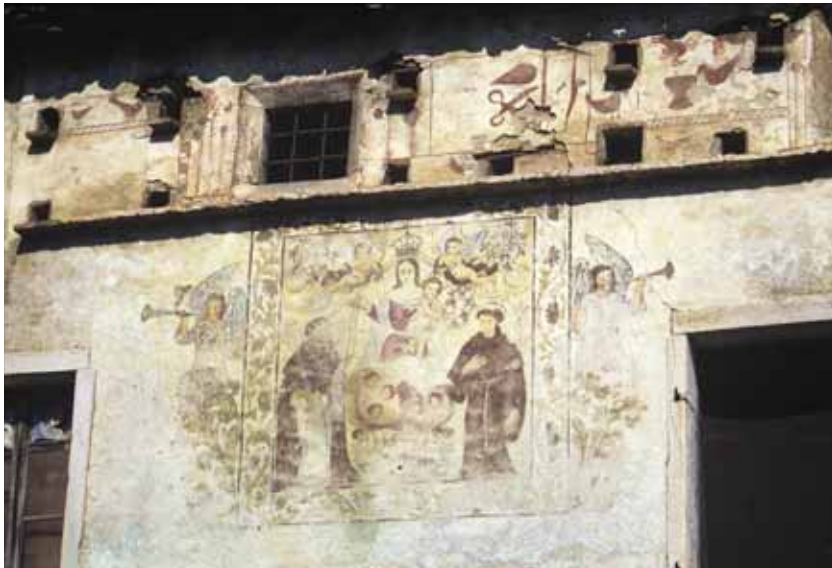
Badia Calavena, contrada Pergari, n. 9-10: Madonna del Rosario tra i santi Antonio da Padova e Domenico . Autore: Giosuè Casella (1707).