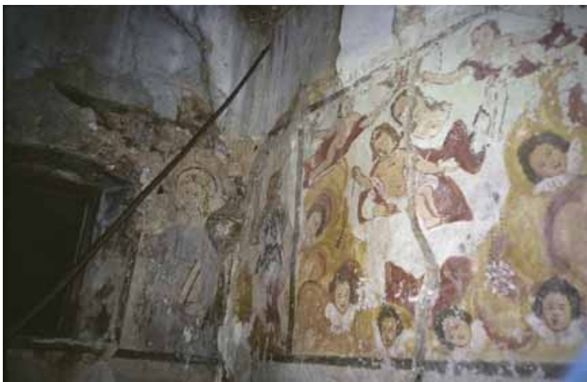
Vallarsa (Tn), loc. Nave: Beata Vergine con Bambino e santi . Autore: Giosuè Casella (1720).