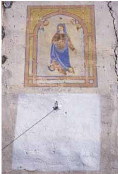
Badia Calavena, contrada Costalunga: Assunta in cielo + Meridiana . Autore: o/c

Nella vicina contrada Righetti, al Casotto dei Mossi, è ancora possibile osservare un brano d'intonaco che fungeva da fondo a una meridiana distrutta dal tempo e dalle fucilate dei tedeschi durante l'ultimo conflitto. Ancor oggi gli abitanti del luogo ricordano la precisione con cui essa scandiva le ore.