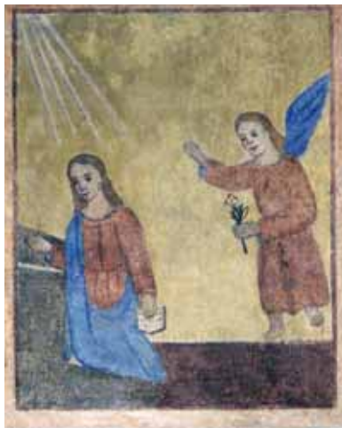
Tregnago, loc. Scornano, Corte del Re: Annunciazione. Autore: o/c.