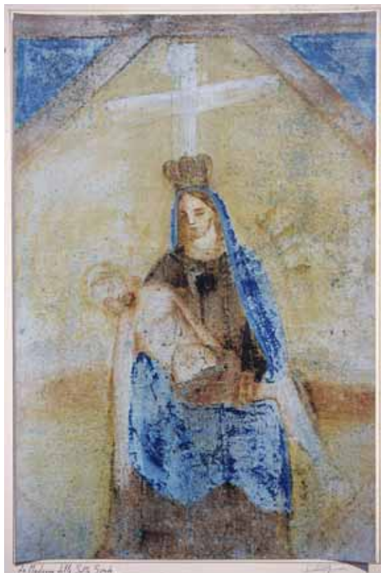
Badia Calavena, contrada Cucio: Pietà . Autore: o/c.

L'Addolorata, coronata e con il cuore trafitto da sette pugnali, sorregge il Figlio riverso sulle sue ginocchia. Ai vertici la cornice forma dei triangoli celesti. Opera recentemente restaurata.