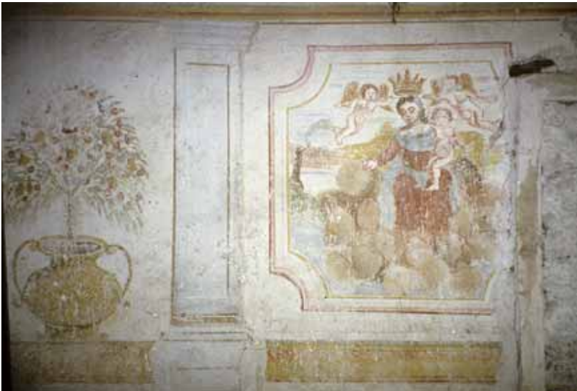
Badia Calavena, loc. Valcava: Madonna Lauretana + Madonna del Rosario .

Significativa coppia d'affreschi realizzati entro un fienile di un edificio datato 1606. Due riquadri contrapposti d'elevata qualità estetica, sono affiancati da turiboli e vasi di fiori, simboli del tributo salvifico e dell'offerta devozionale. Benché le due opere molto ricordino il Casella, qui emerge un modello grafico diverso, riferibile alla Madonna con Bambino di contrada Pagani di Campofontana.