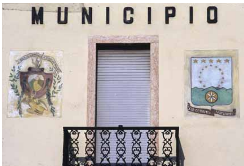
Badia Calavena, Piazza del Municipio: Due stemmi.

Il secondo è caratterizzato da uno scenario montagnoso, sul quale spicca il simbolo solare e una corona di tredici stelle con altre cinque di maggior dimensione.