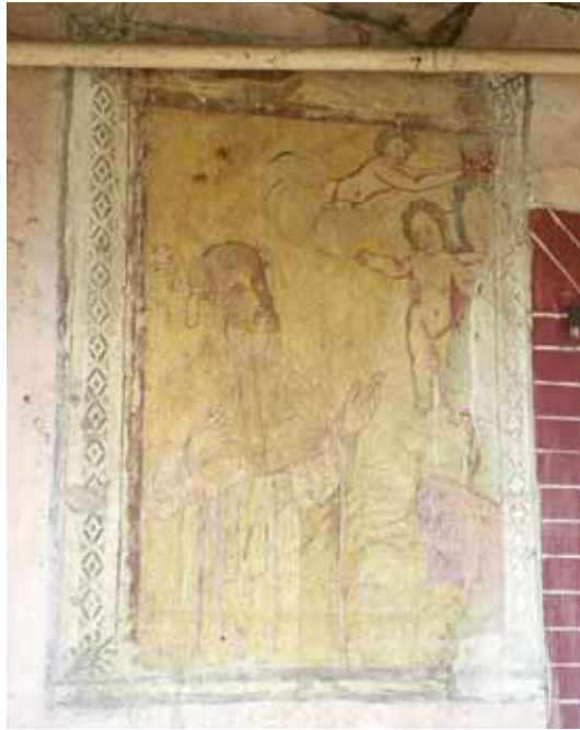
Badia Calavena, contrada Pellicari, n. 3: Madonna con Bambino e s. Antonio da Padova.

Il dipinto potrebbe essere un rifacimento dell'o/c di un testo più antico, forse del Casella. La scenografia, mutilata da una finestra, era equilibrata a destra da un altro santo – forse Domenico – e da un altro angelo. Chi ha cercato di ovviare all'ammanco ha riprodotto nella cornice di destra il motivo originale della fascia sinistra, ma la differenza stilistica appare evidente. Il documento alloggia sotto un portico sostenuto da due artistiche colonne in pietra. Un angelo esce da una nuvola per incoronare la Vergine, che tiene tra le braccia il Bambino intento a offrire la corona del rosario al santo col giglio.