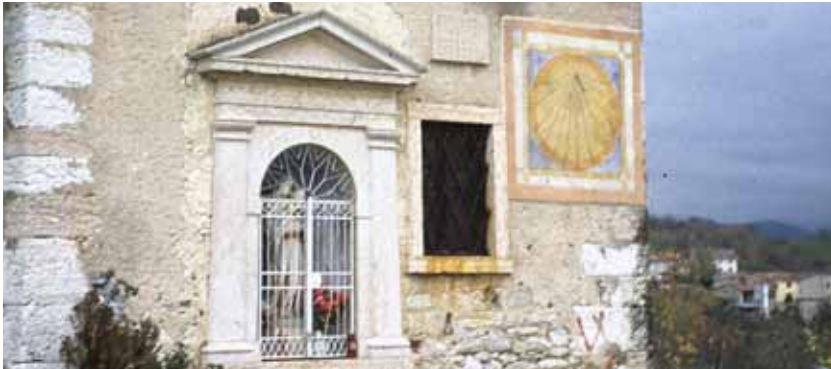
Badia Calavena, contrada Pernigo: Meridiana . Autore: o/c.

Opera notevole stesa sopra una “casàra”, recentemente restaurata. La meridiana affianca un capitello scultoreo raffigurante la Vergine.