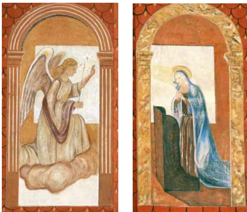
Badia Calavena, Palazzo Fritz: Annunciazione .

La parte superiore dell'edificio è decorata con il tema dell'Annunciazione. La Vergine e l'angelo annunciante sono divisi da un verone. Una ricca cornice floreale accompagna la narrazione.