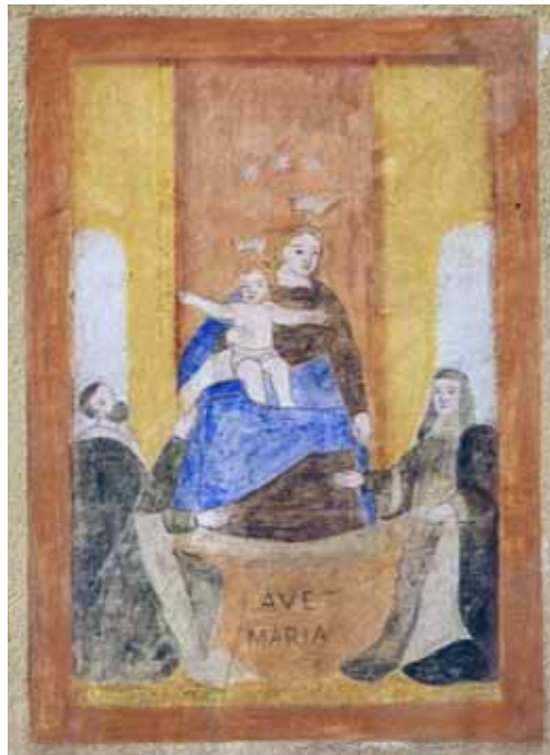
Badia Calavena, loc. Sant'Andrea, Tretteni, n. 2-3 : Madonna di Pompei . Autore: o/c.

Prova sbiadita stesa all'inizio della frazione. Madre e Figlio, assisi su un trono, donano la corona del rosario ai santi Domenico e Caterina genuflessi ai loro piedi.