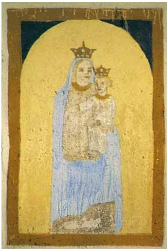
Badia Calavena, contrada Riva: Madonna con Bambino . Autore: o/c.

Testo rifatto. Una grezza cornice nocciola con spicchi blu delimita Vergine e Bambino coronati, i quali indossano una veste conclusa sul collo da un orlo del medesimo colore della cornice.