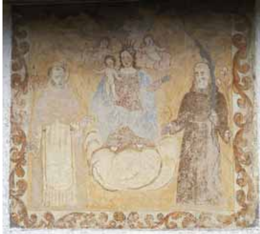
Badia Calavena, contrada Riva: Madonna del Rosario tra i santi Antonio da Padova e Domenico . Autore: Giosuè Casella.

Assisa su nuvola, una sorridente Vergine incoronata da cherubini tiene sulle ginocchia il Bambino nudo. Schematico il racconto e rigido l'impianto compositivo. La cornice riprende in tono minore stilemi caselliani in parte utilizzati nella prova dei Pergari. I santi, rappresentati a figura intera e con i gigli in mano, affiancano la protagonista che indossa un manto azzurro sopra una veste ricamata.