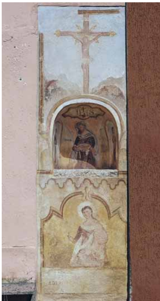
Badia Calavena, contrada Carpane, n. 2: Trittico Crocifissione, Addolorata, Madonna del Rosario.