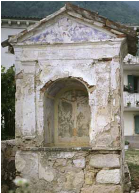
Badia Calavena, contrada Trettene: Crocifissione . Autore: o/c.

Il capitello, in pietra bocciardata e muratura, è stato fatto innalzare nel 1890 da certo Giovanni Trettene. Si compone di zoccolo ed edicola, nella quale è dipinta una Crocifissione. Sulle spallette laterali sono tratteggiati due santi (forse Antonio da Padova e Lucia). Un timpano dipinto a tinte cerulee e due colonnine aggettanti completano l'insieme. Sull'architrave un'epigrafe ricorda la visita del cardinale Luigi di Canossa.