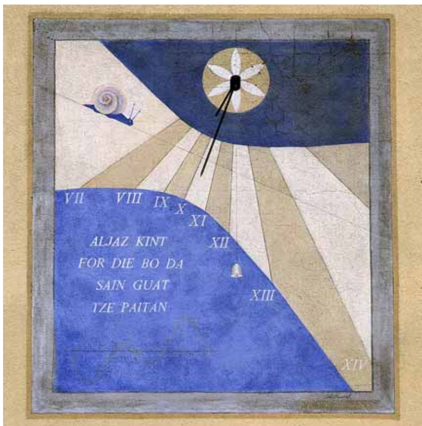
Badia Calavena, loc. Sant'Andrea: Meridiana . Autore: Caterina Caporal (2003).

scende un bogón (chiocciola): emblema sia della fiera delle lumache che annualmente si tiene nella frazione di Badia, sia del lento scorrere del tempo. L'adagio "cimbro" ALJAZ KINT FOR DIE BO DA SAIN GUAT TZE PAITAN, riflette un antico detto del luogo: TUTTO ARRIVA PER COLORO CHE SONO CAPACI DI ASPETTARE. Più sotto la firma dell'autrice e la sigla: PP. FF. a. 2003 («Paolo Presa fece fare anno 2003»).