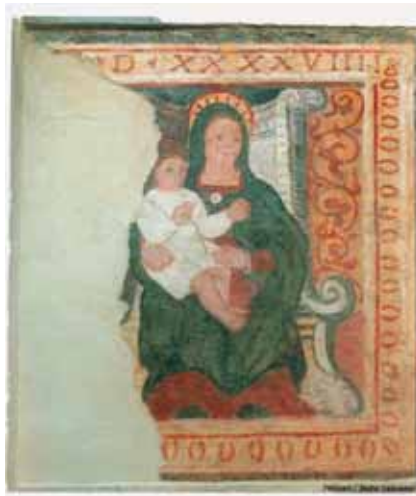
Badia Calavena, contrada Pellicari: Madonna in trono con Bambino (1549).

L'immagine – riprodotta da Pietro Mantovani in Badia Calavena. Feudo monastico , Grafiche Busti, Colognola ai Colli (Vr), 2003, p. 223 – insiste all'interno di una torre-colombaia ristrutturata. La devozione, di evidente carattere privato, sottolinea la rilevanza sociale goduta della famiglia Pellicari e, in un'accezione più ampia, il legame spirituale che univa le contrade di Badia Calavena all'abbazia benedettina che sorge poco lontana. La Vergine, in veste rossa e manto scuro, è raffigurata assisa sopra un maestoso trono mentre regge sulle ginocchia un Bambinello benedicente vestito con una candida tunichetta. Il margine sinistro dell'affresco risulta abraso, mentre una cornice a motivi ocracei orna il limite destro e la base del racconto. Nella parte superiore sono chiaramente leggibili le cifre DXXXVIII – orfane della M – che fanno di questa pittura una delle più antiche della Lessinia. Il restauro ha evidenziato negli occhi del Bambino e nelle mani della Vergine una precedente manomissione attribuibile all' o/c .