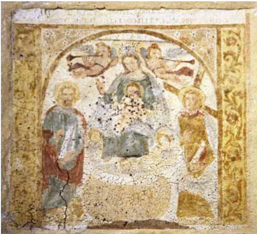
Ala (Tn), Val dei Ronchi, loc. Ronchi: Beata Vergine con Bambino e santi . Autore: Giosuè Casella (forse 1723).

del Rosario affiancate da turiboli e vasi di fiori. Nel complesso questa fase interlocutoria è contraddistinta da prove finalizzate a immortalare voti per cessate pestilenze, guerre e epidemie. Sarà necessario attendere gli ultimi decenni dell'Ottocento perché lo scenario della pittura murale lessinica muti radicalmente, grazie al furore artistico di un madonàro che, pur non avendo mai posto la propria firma in calce a un'opera, ha lasciato dietro sé una traccia lunga come nessuno prima di lui aveva saputo fare.