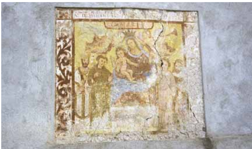
Ala (Tn), loc. Del Mas: Beata Vergine con Bambino e santi . Autore: Giosuè Casella (forse 1725).