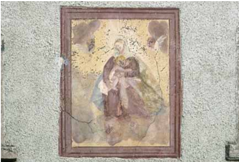
Badia Calavena, loc. Sant'Andrea, via Triga, n. 4: Madonna con Bambino.

Celebre documento sito sulla facciata dell'ex "Ostaria de la Gata". Pastose le tonalità ed elegante il disegno. Nella parte inferiore, prima che la scritta venisse ricoperta dal nuovo intonaco, un motto invitava il pellegrino a fermarsi per riverir Maria.