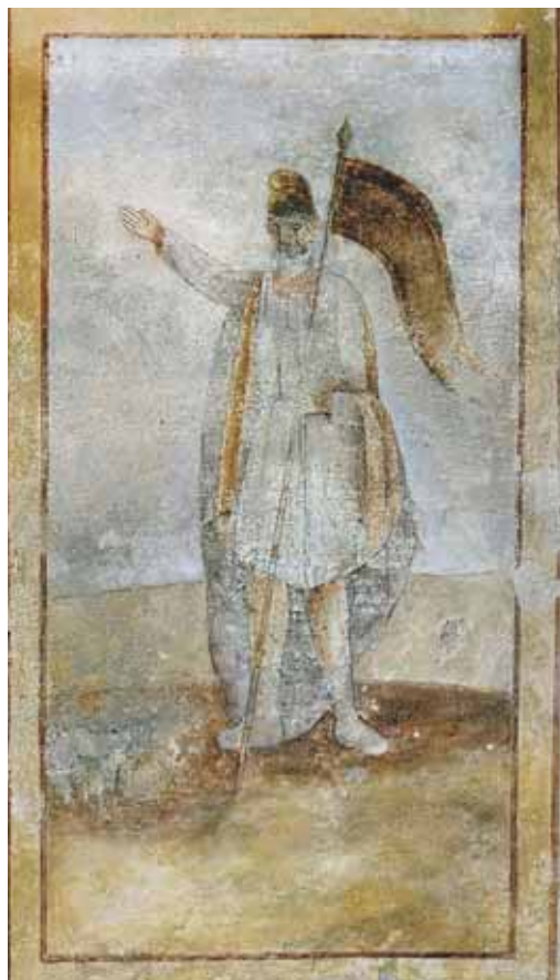
Badia Calavena, contrada Trettene: S. Bovo . Autore: o/c.

La raffigurazione evidenzia d'acchito gli elementi identificativi del santo: l'elmo del cavaliere, lo stendardo del cristianesimo, la tunica simbolo di penitenza.