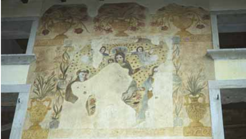
Badia Calavena, contrada Venturi: Madonna del Rosario e santi . Autore: Giosuè Casella (1688).

Questa pittura, segnalata solo di recente, è la più antica di Giosuè Casella e dilata l'attività del madonàro a un totale di ben 37 anni. Il testo campeggia sulla facciata meridionale di un fabbricato curtense. All'interno di una sfarzosa cornice, spiccano da un fondale giallo punteggiato di stelle, la Madre e il Bambino assisi su nuvole intenti a donare la corona del rosario a due santi, di cui quello di sinistra indossa il saio e quello di destra una veste oca con sopra un manto azzurro. Due angeli riccioluti pongono la corona sul capo della Vergine dando fiato alle trombe. Nella parte superiore l'affresco è concluso da una larga fascia esornativa composta da tre vasi traboccanti fiori rossi e blu. Altri due vasi ricolmi stanno a lato dei santi. Alla base del testo un'epigrafe ricorda il committente e la data d'esecuzione: GIUGNO L'ANNO 1688. Purtroppo la fase pittorica, appena protetta da una fatiscante gronda in legno, è rovinata in più parti e ampi risultano gli ammanchi.