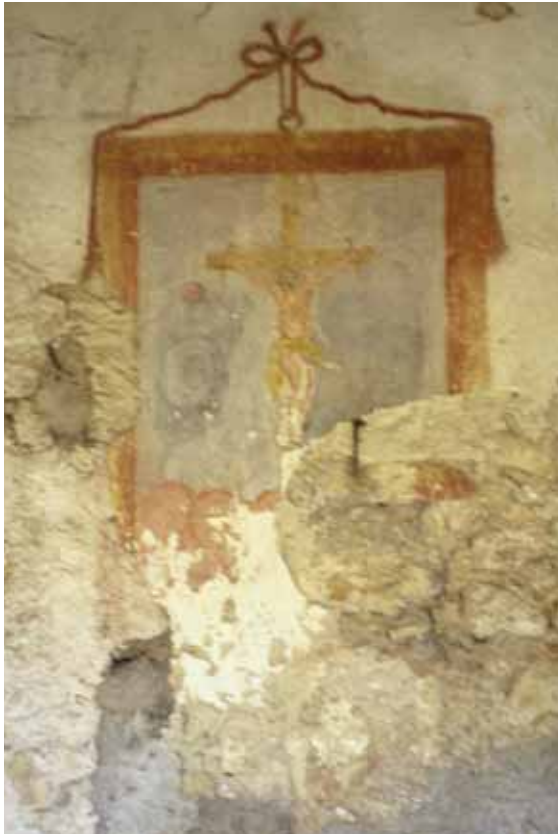
Badia Calavena, contrada Pergari, n. 9: Crocifissione .

La tempera, in buona parte abrasa, è protetta da un portico fatiscante e si presenta come un finto quadro sostenuto da un cordone rosso. Il Cristo ha il corpo rivestito da un misero panno e le mani trafitte da lunghi chiodi. La base del documento, benché, rovinata, lascia intravedere una nuvolaglia rossastra.