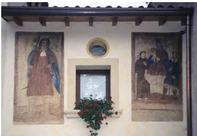
Tregnago, loc. Scornano, Corte del Re: Madonna del Rosario + El Re .