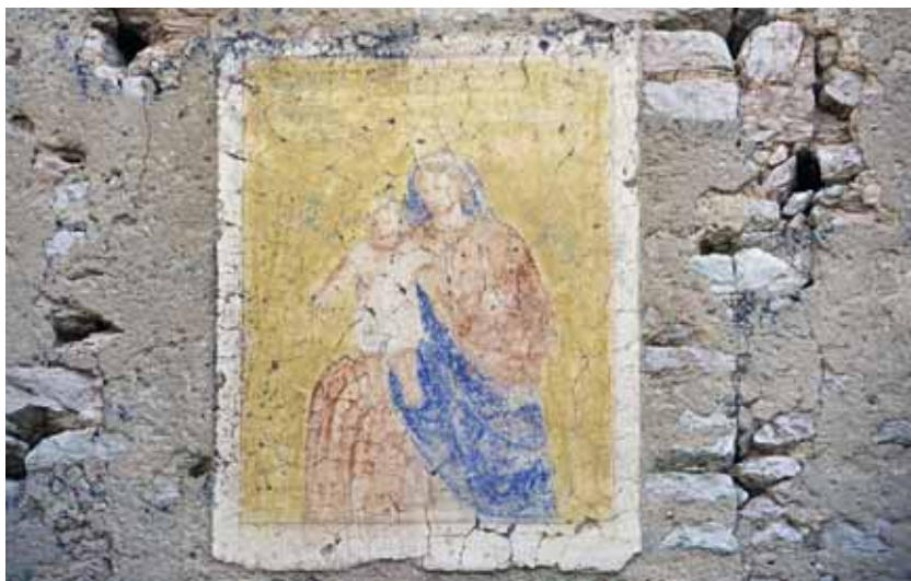
Marano di Valpolicella: Madonna con Bambino . Autore: o/c.

pitture, datate 1880, sono stese nel confinante comune di Selva di Progno. Eppure mi lasciava dubbioso la sigla 1884 posta in calce alla Sacra Famiglia di Aneposse (Sant'Anna d'Alfaedo). Una cifra inaccettabile in un lembo così occidentale dell'altopiano se si pensa che in Val d'Illasi alcuni brani datano 1890 e, addirittura, 1895. Inizialmente tentai di giustificare la stranezza col fatto che la tempera, offesa da alcune sassate, celasse l'esatta lettura, ma successivi rilievi sciolsero definitivamente ogni indugio confermando ciò che da tempo sospettavo e, cioè, che l'occidente lessinico e la Valpolicella non abbiano rappresentato il punto conclusivo dell'itinerario barchesco ma, piuttosto, una vasta e faconda parentesi prima della ripresa operativa in Val d'Illasi. La conferma l'ebbi allorché inumidendo delicatamente alla base la Madonna del Rosario di contrada Massarìn di Sopra (Marano di Valpolicella) inequivocabilmente apparve la data 1883 e, successivamente, scopersi appartenergli, pure, l'addobbo a drappi e cherubini esterno alla nicchia di contrada Séngia Rossa (Fumane) datato 1887.