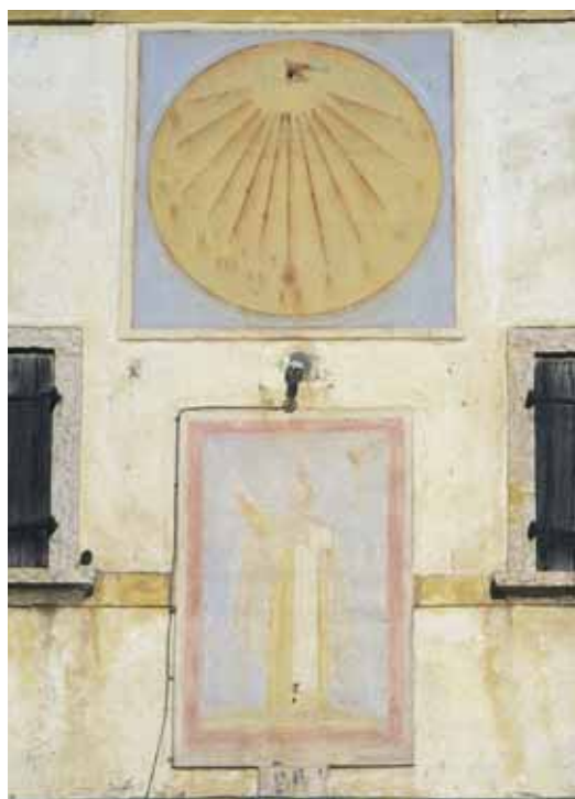
Badia Calavena, contrada Pegari: S. Vincenzo Ferrer + Meridiana . Autore: o/c (1895).

Sulla facciata di un massiccio edificio si ammirano due prove dell'o/c: una meridiana sovrastante un s. Vincenzo, quest'ultimo raffigurato in atteggiamento del tutto simile a quello di contrada Biasini. Sopra è incorniciata la data 1895 e la sigla S. G.