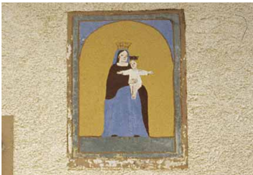
Badia Calavena, loc. Sant'Andrea, via Xami, n. 2: Madonna con Bambino . Autore: o/c.

Il testo, pesantemente rifatto, è riferibile a quello di contrada Riva: simile lo sfondo e la disposizione dei personaggi.