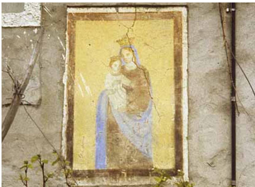
Badia Calavena, contrada Fugazzetti: Madonna con Bambino . Autore: o/c.

Pur nella modestia tipologica, l'opera si caratterizza per la collocazione sulla facciata di una contrada celata tra le pendici boschose di un colle. Discreto lo stato di conservazione.