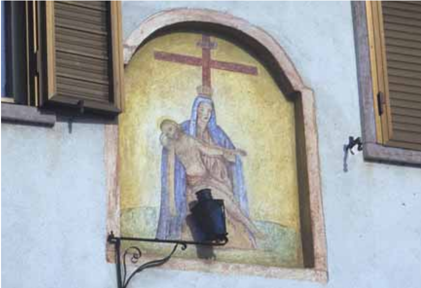
Badia Calavena, loc. Sant'Andrea, Via Triga, n. 20: Pietà . Autore: o/c.

Tempera di grande intensità che fonde la raffigurazione della Pietà con quella dei “Sette dolori”. La Croce fa da contrappunto allo struggimento di Maria, colta nel gesto di cingere la spalla al Figlio mentre, nel contempo, gli solleva con infinita dolcezza la mano. Due salici piangenti, dalle fronde azzurre come il colore delle lacrime, sembrano partecipare al momento doloroso.