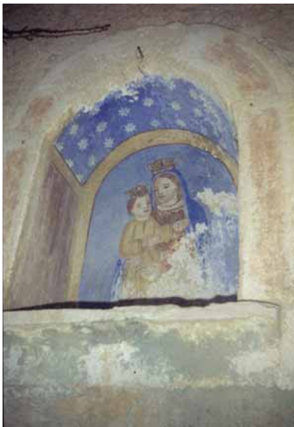
Badia Calavena, contrada Totari: Madonna con Bambino . Autore: o/c.

Ambedue le figure sono coronate e ritratte sul fondo azzurro stellato di una piccola nicchia. Il collo della Vergine è ornato da una collana di perle.