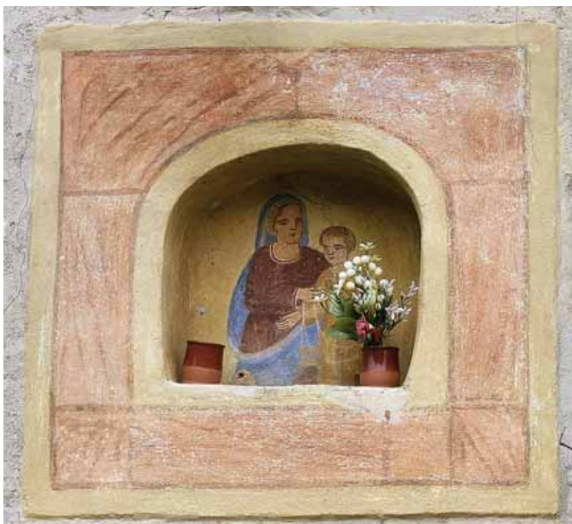
Badia Calavena, contrada Antonelli: Madonna con Bambino . Autore: o/c.

La tempera insiste all'interno di una nicchia presso l'arco d'accesso di una corte. L'autore, con qualche "terra" e una grafia elementare, è riuscito a trasmettere un messaggio protettivo, accentuato dall'espressione serena della Madre che sostiene un Bambino ormai grandicello.