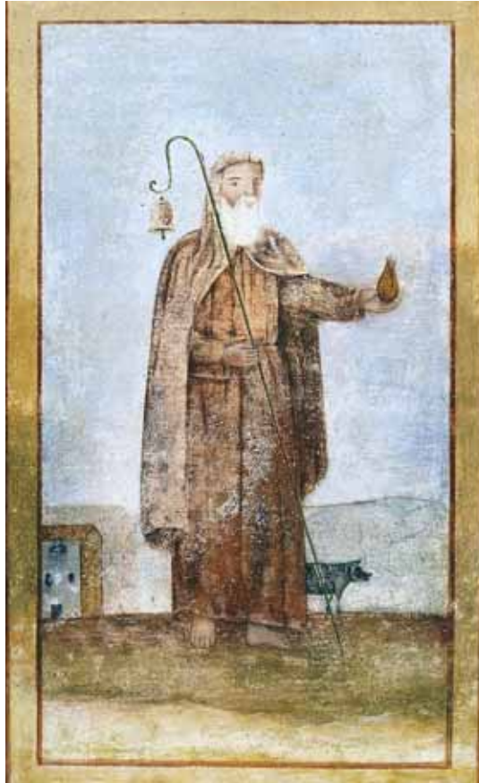
Badia Calavena, contrada Trettene: S. Antonio abate . Autore: o/c.

S. Antonio abate, ritratto con l'inseparabile maialino, il fuoco, il bordone e la campanella, fa da pendant a s. Bovo, l'altro adiutor invocato a protezione del bestiame. Ancor oggi le loro immagini vengono affisse agli usci delle stalle della Lessinia.