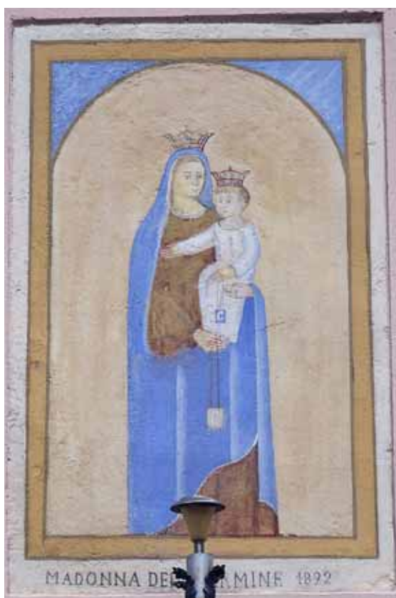
Badia Calavena, contrada Antonelli: Madonna del Carmine . Autore: o/c (1892).

Il testo è stato alterato da un rifacimento che ha “aperto gli occhi” ai personaggi, dalle cui mani pendono gli scapolari siglati con una C.