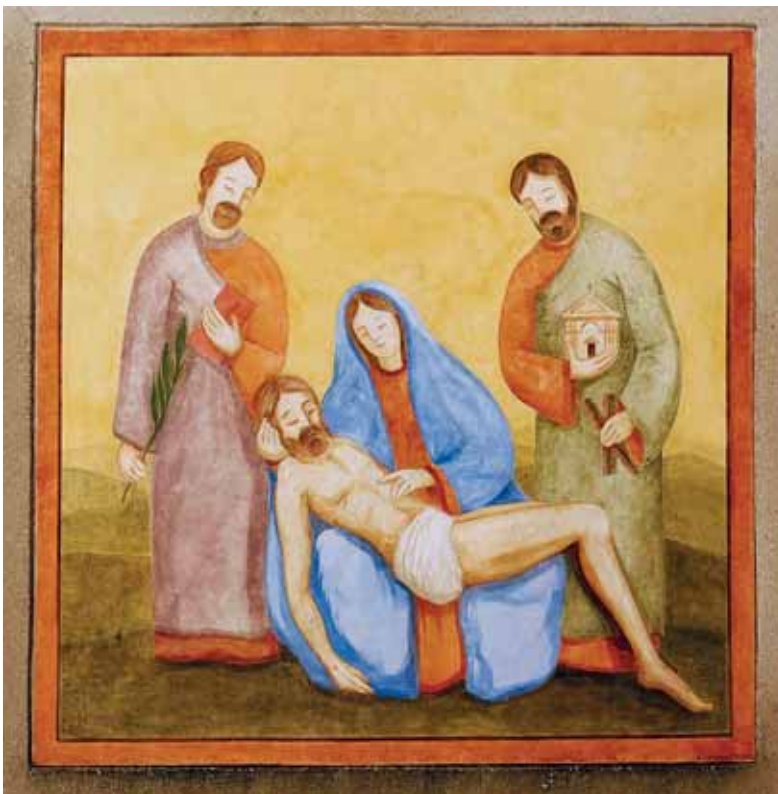
Pitture murali di Badia Calavena

Mi auguro che la nuova rappresentazione possa rievocare l’antica sacralità del luogo in cui è collocata, e magari innescare un po’ di curiosità e la voglia di riscoprire i piccoli gioielli di sincera devozione che ci hanno lasciato le antiche genti di questa straordinaria Valle picta ».