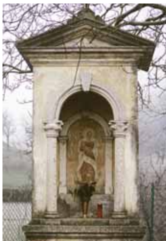
Badia Calavena, inizio paese: Capitello Immacolata.

La devozione sorveglia l’accesso meridionale di Badia Calavena. L’Immacolata, serenamente atteggiata tra festosi angioletti, poggia il piede su una mezzaluna sotto cui s’annida la serpe, simbolo del male. Il fondo ben si sposa con la veste rossa che ne avvolge il corpo slanciato, appena appesantito da uno svolazzante mantello biancazzurro. Osservando attentamente il dipinto, si nota uno sfregio. Narra la leggenda che un viandante, colto dall’ira, abbia violato con una lama l’effigie, ma tosto la mano sacrilega cadde al suolo mozzata da una forza invisibile.