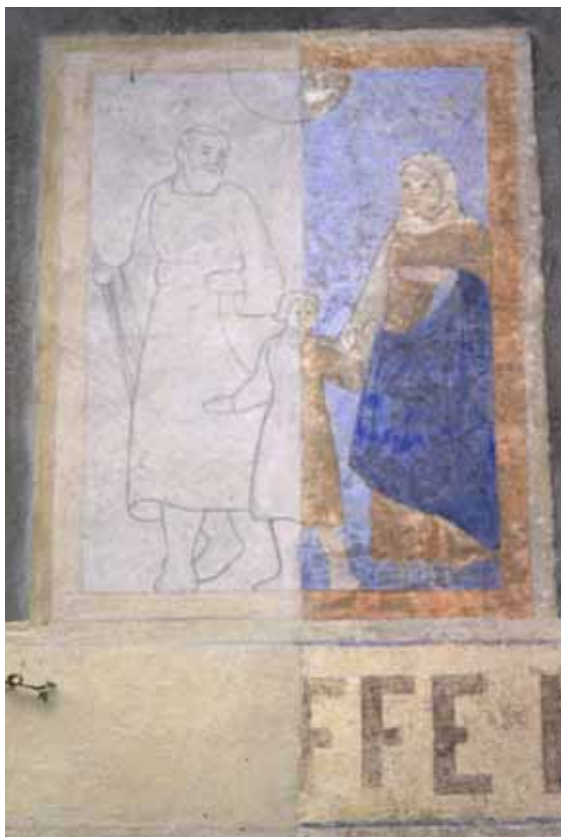
Badia Calavena, contrada Boschi: Sacra Famiglia , Autore: o/c.

Un tempestivo restauro ha consentito il recupero in tutto lo splendore di un soggetto tra i più amati dall'autore.